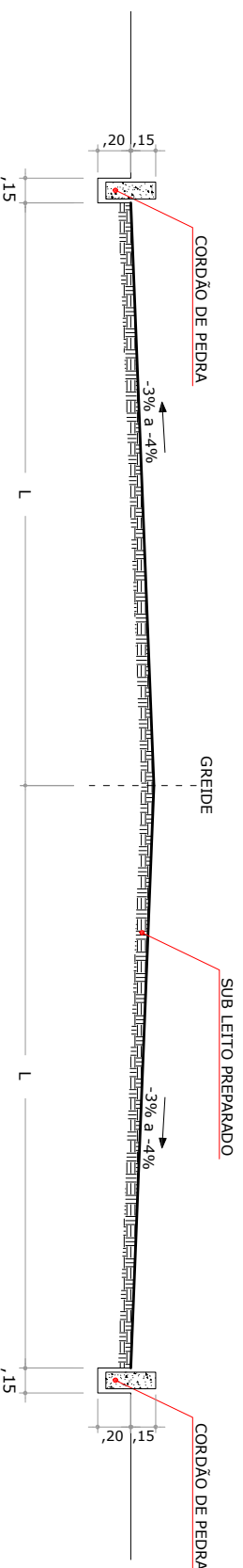
FIGURA 06 - COLOCAÇÃO DE CORDÃO Sem Escala