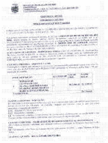
Imagem (4).jpg ~721 KB

Bom dia, segue em anexo contrato referente aos serviços contratados, favor conferir se esta tudo ok, assinar e me enviar.