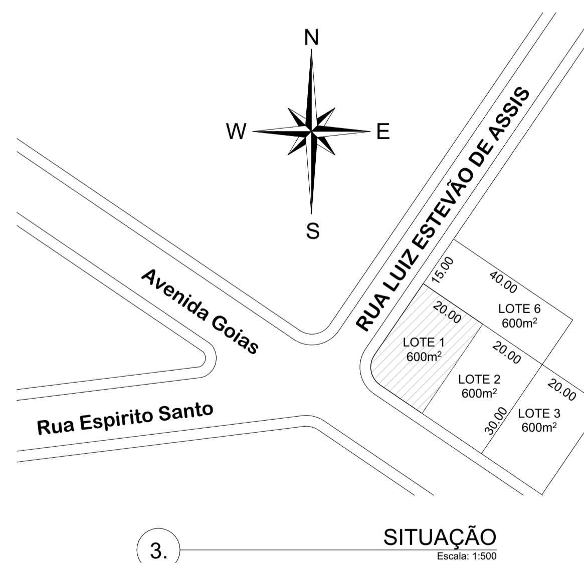
3. SITUAÇÃO Escala: 1:500